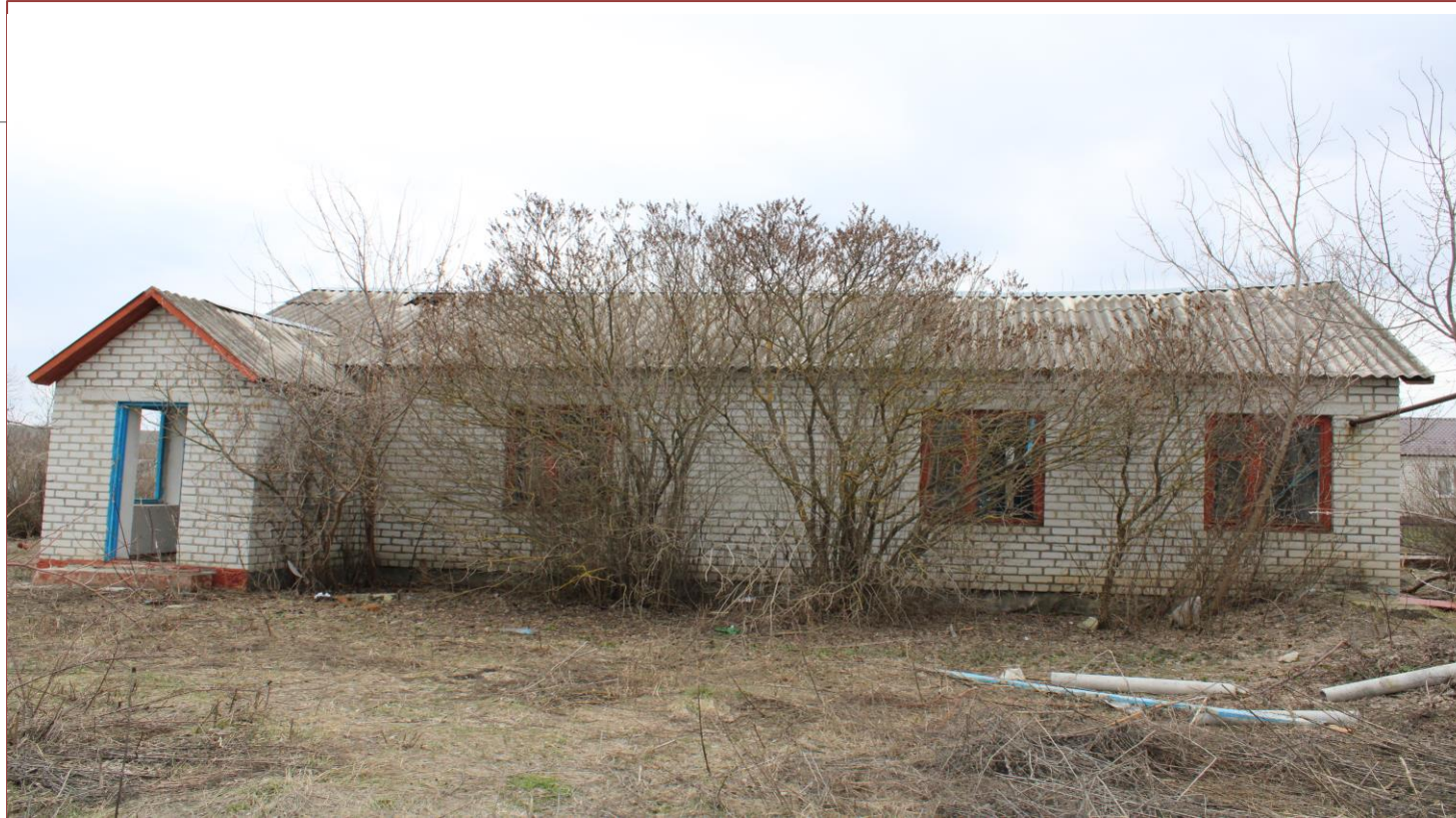
Нежилое здание к.н. 31:24:0202004:96